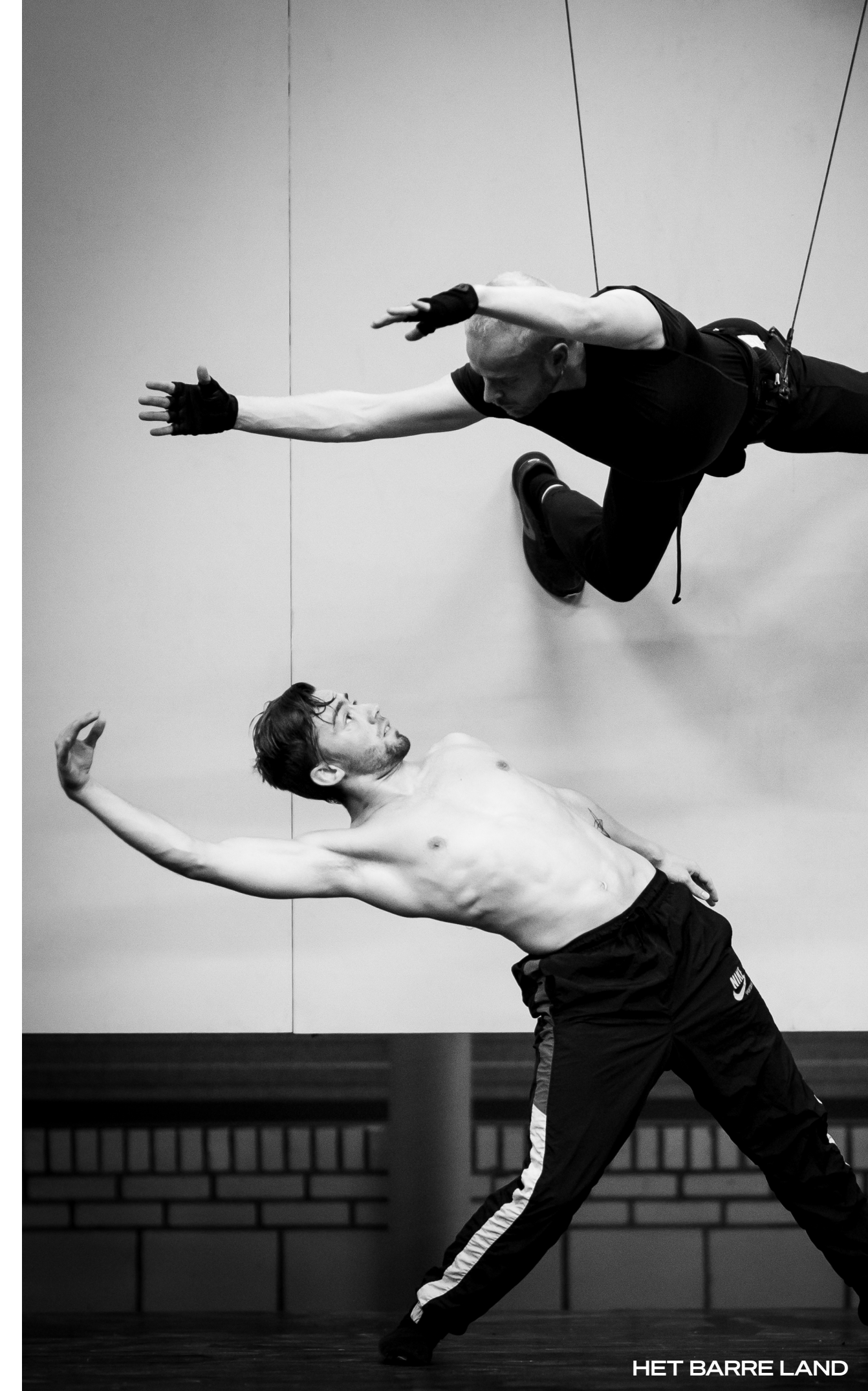
HET BARRE LAND

Het exploitatieresultaat zal naar verwachting verdeeld worden tussen het bestemmingsfonds Fonds Podiumkunsten (152.189) en de bestemmingsreserves (55.521).