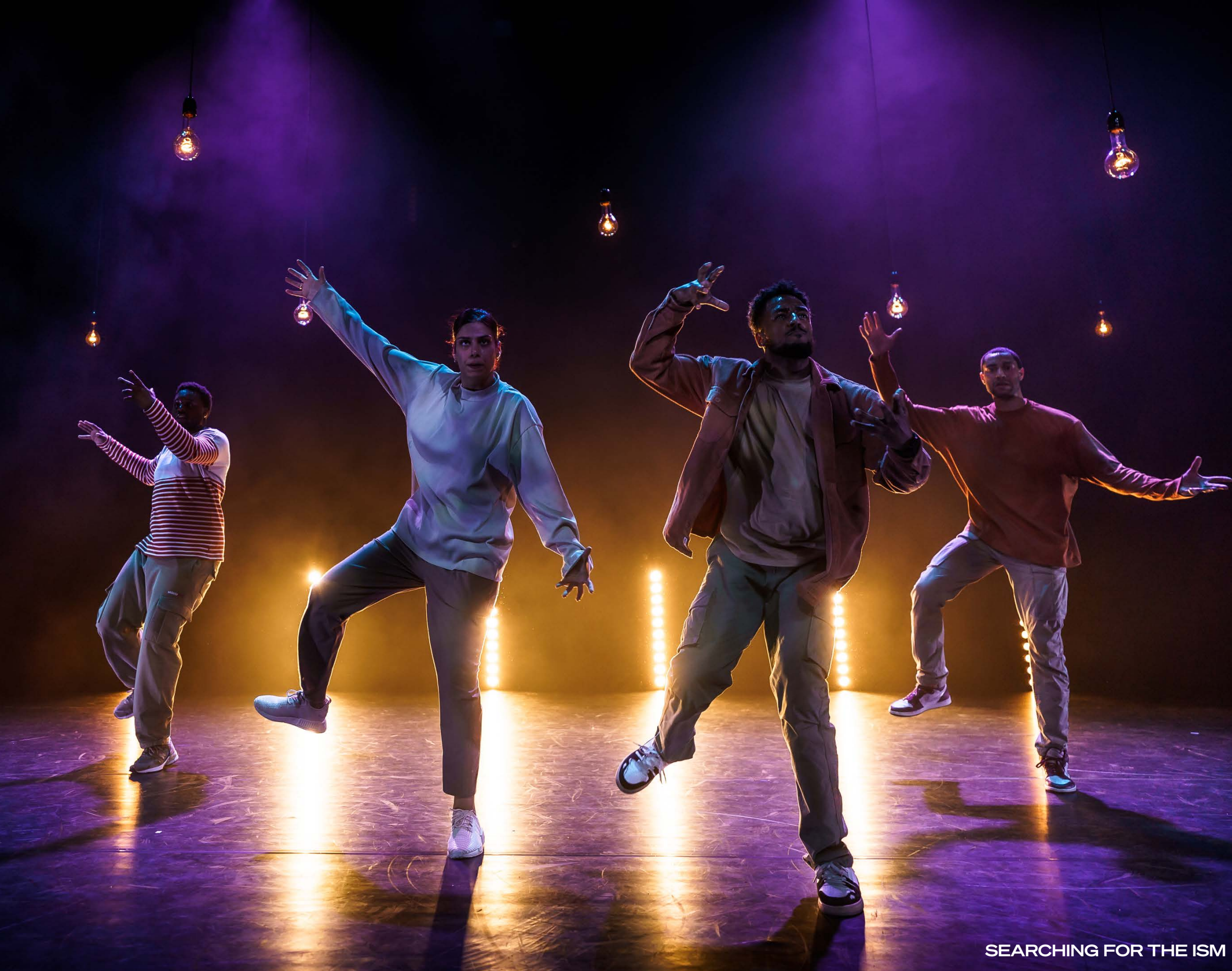
SEARCHING FOR THE ISM